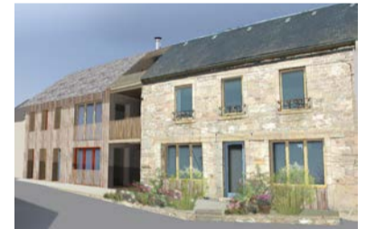
Maison intergénérationnelle de bourg : deux parcelles mitoyennes sont assemblées pour former 4 logements adaptés et une salle commune pour bien vieillir chez soi