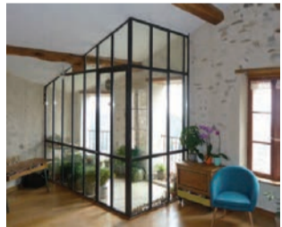
Réhabilitation d'une ancienne remise à Saissac (Aude) avec de nouvelles ouvertures et une loggia intérieure