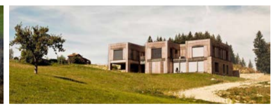
Éco-hameau de Bertignat : 3 logements communaux en habitat groupé, constructions en auto-promotion, salle des fêtes et Bains Ruraux. PNR du Livradois-Forez - Boris Bouchet architecte, 2013

Maison rurale regroupant centre de santé communal et petit commerce. Construction BBC en bois et pisé.