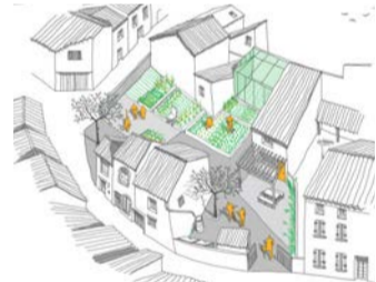
Revivre en centre-bourg : méthodologie et outils CAUE de l'Aude