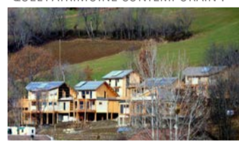
Éco-hameau en auto-construction 6 maisons et d'une salle commune Les Allouvières, Romette (Gap), R. Marlin architecte